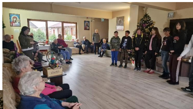
persoane vârstnice „Vasiliada” Oradea

✚ Context : „Sărbătorim Unirea” activitate desfășurată în cadrul proiectului SNAC „Fă Rai din ce ai” în parteneriat cu Căminul pentru persoane vârstnice „Vasiliada” Oradea